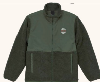
プロデュースフリースグリーン

シンプルでありながら存在感のあるブランド ロゴが入っており、ビジネスやカジュアルな シーンで便利に活用できる汎用性の高い プロデュースボタンダウンポロシャツ