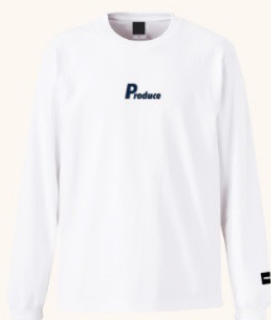
プロデュースロングスリーブTシャツ

サラッとした素材感で季節感を問わず着られる ロングスリーブTシャツ。 軽くて柔らかい素材感が特徴です。品質や デザイン、着心地にもこだわった一枚です。