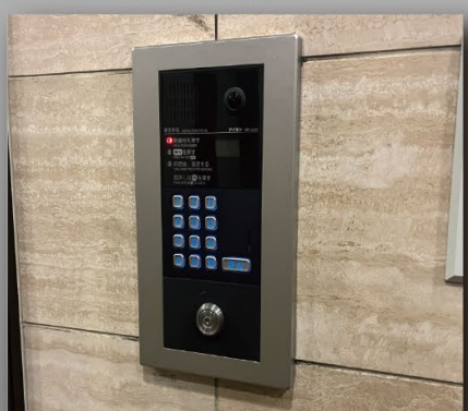
オートロック・モニターホン