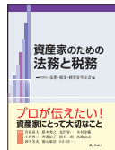
プロが伝えたい! 資産家にとって大切なこと 相続税と法務と税務