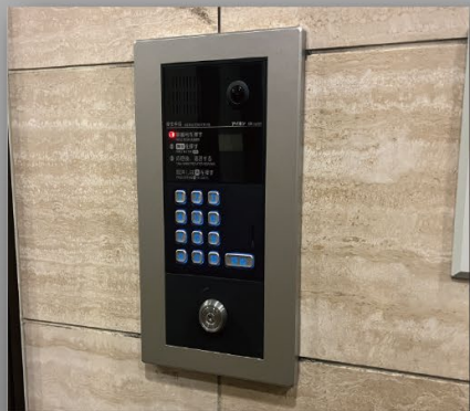
オートロック・モニターホン